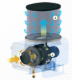
Yağ buharı toplayıcı