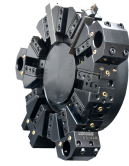
PBTP80 RAGATI torna başlığı